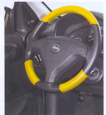
...of geel/zwart i 71 18 211.