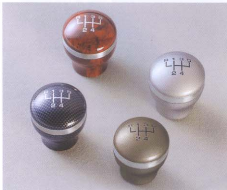
Versnellingspookknop in wortelhout-, Carbon-, titaan- of aluminium-look met aluminium tussenring ...