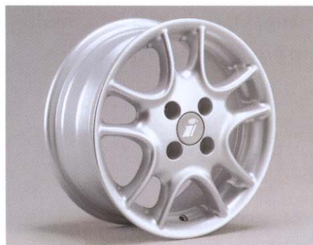
Sportieve lichtmetalen velgen in Twin Spoke-design ...