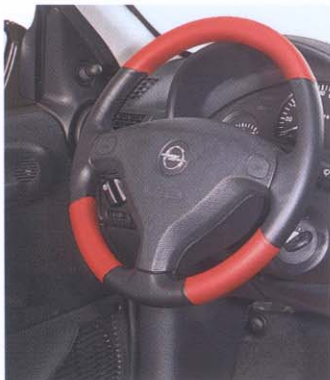
Exclusief design: lederen stuurwielrand in rood/zwart i 71 18 209...