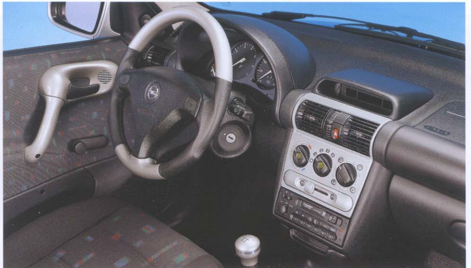
Interieurset in aluminium-look i 12 17 093 met bijpassende versnellingspookknop i 95 17 317.

Voor een uiterst persoonlijke verfraaiing van het interieur staan hoogwaardige interieursets ter beschikking in de klassieke wortelhout-, sportieve Carbon-, of hedendaagse aluminium-look. De uitgekozen interieursets harmoniëren bovendien zowel met de verschillende bijpassende versnellingspookknoppen in wortelhout-, Carbon-, aluminium- en Titaan-look, als met de exclusieve ledercombinaties voor de stuurwielrand en de hoezen rond de versnellingspook en de handrem.