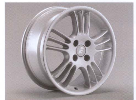
... en in Spectra Line-design.