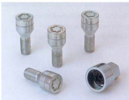
OPEL i LINE slotboutenset i 61 10 118.