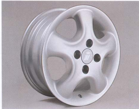
Lichtmetalen velg in elegant Softline-design.

precies op de Corsa afgestemd. Hun belangrijkste pluspunten zijn: betere wegligging in de bochten, meer baanvastheid en verhoogde veiligheid bij het remmen en het accelereren.