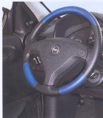
...blauw/zwart i 71 18 210...