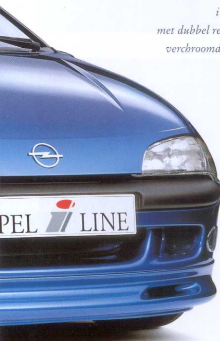
OPEL i LINE uitlaatnademper i 19 08 001 met dubbel rechtboekig verchromd eindstuk.