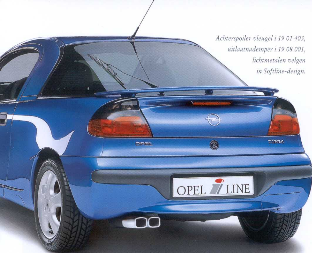
Achterspoiler vleugel i 19 01 403, uitlaatnademper i 19 08 001, lichtmetalen velgen in Softline-design.

De speciaal voor de Tigra ontworpen verlagingsset zorgt voor een optimale wegligging en meer zekerheid. Nog meer veiligheid in de bochten, bij het remmen en het accelereren zijn de belangrijkste kenmerken.