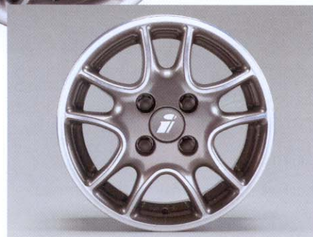
Lichtmetalen velgen in Twin Spoke Exclusive-design in de afmeting 6 x 14.