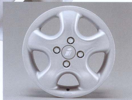
Lichtmetalen velg in Softline-design in de afmetingen 5½ x 14 tot 7 x 16.