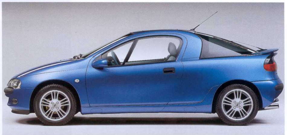
Zij-richtingaanwijzers, wit i 12 12 040, lichtmetalen velgen in Spectra Line-design.

De hoge eisen ten aanzien van productkwaliteit en montage worden door de Irsmscher-groep gewaarborgd door een uitgebalanceerd kwaliteitsmanagement systeem. Met het verleende ISO 9001 certificaat wordt dit bevestigd.