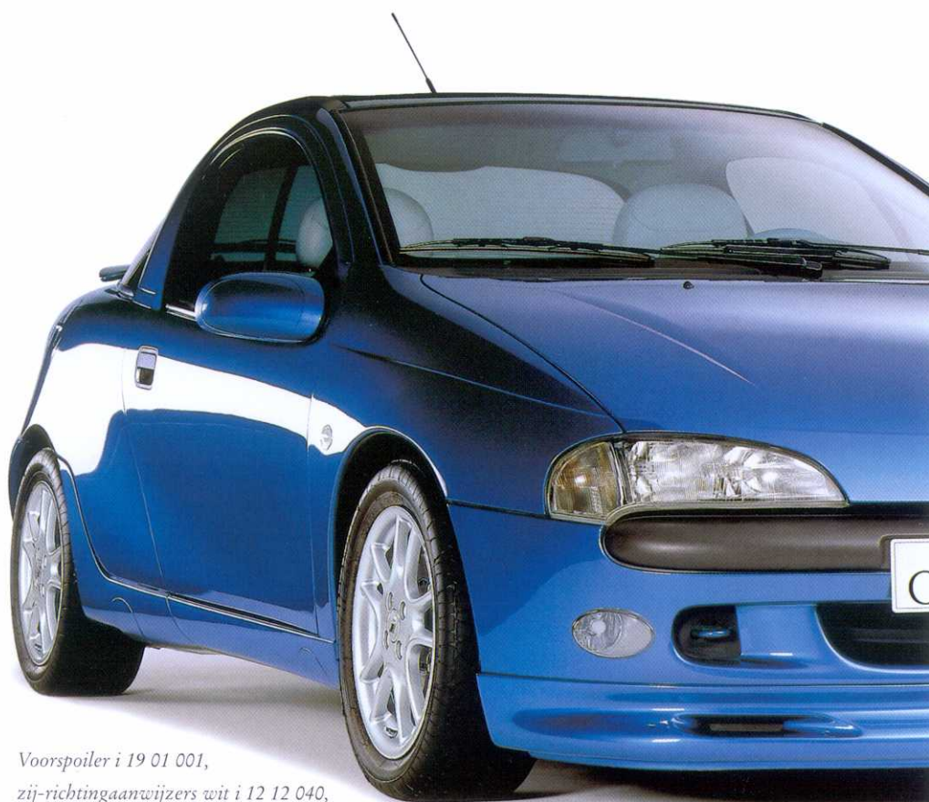
Voorspoiler i 19 01 001, zij-richtingaanwijzers wit i 12 12 040, lichtmetalen velgen in Twin Spoke-design.

De OPEL i LINE lichtmetalen velgen van hoogwaardige kwaliteit en in verschillende uitvoeringen zijn niet alleen optische blikvangers, maar beantwoorden ook aan essentiële veiligheidsnormen en technische vereisten. Velgeigenschappen zoals optimale materiaalsamenstelling, productieprecisie, gering gewicht, extreme belastbaarheid en een verbeterde wegligging krijgen de hoogste prioriteit. Alle velgen doorlopen een nauwkeurig omschreven testprogramma, dat voor een groot deel is gebaseerd op ervaringen uit de autosport.