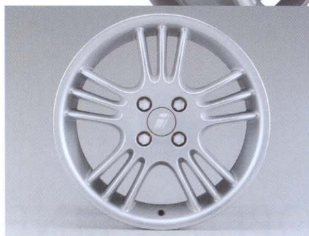
Lichtmetalen velgen in Spectra Line-design in de afmetingen 5½ x 14 tot 6 x 15.

De OPEL i LINE lichtmetalen velgen voldoen aan de strengste normen ten aanzien van materiaal- en kwaliteitsstandaards.