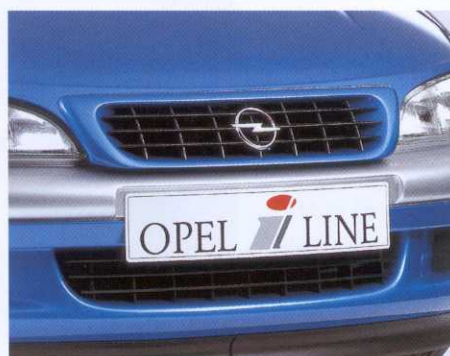
Grille i 19 01 050, grillerooster onder i 19 01 060.