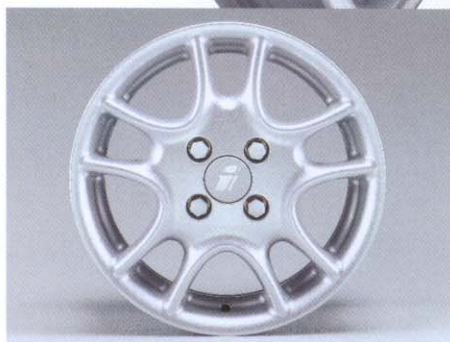
Lichtmetalen velg in Twin Spoke-design in de afmetingen 5½ x 14 tot 7 x 16.