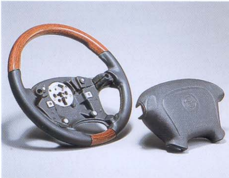
Noblesse: wortelhouten/lederen stuurwielrand i 71 18 014.

De wortelhouten/lederen OPEL i LINE stuurwielrand, voor het stuur met standaard airbag, en het wortelhouten asbakdeksel, instrumentenpaneel en versnellingspook-knop geven het interieur een luxueuze uitstraling.