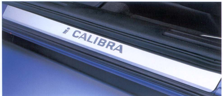
Een sportief-elegante blikvanger: dorpelbeschermlijstenset i 27 17 400 (2 stuks) van roestvrij staal met Calibra-opschrift en OPEL i LINE logo.