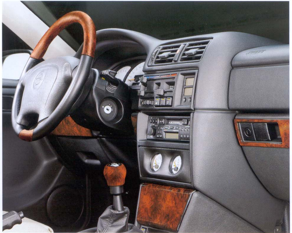
Luxeus en elegant interieur: houten/lederen stuurwielrand i 71 18 014, wortelhouten instrumentenpaneel i 24 17 124, wortelhouten asbakdeksel i 24 17 123, en versnellingspookknop in wortelhout look i 95 17 209.