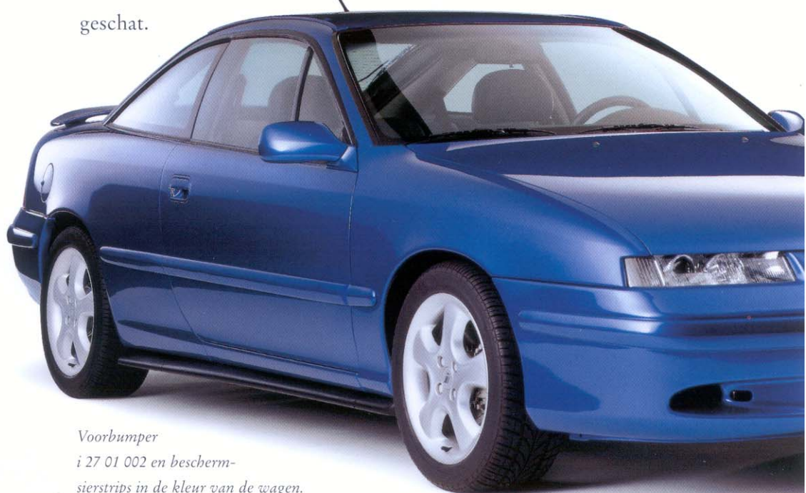
Voorbumper i 27 01 002 en bescherm- sierstrips in de kleur van de wagen.